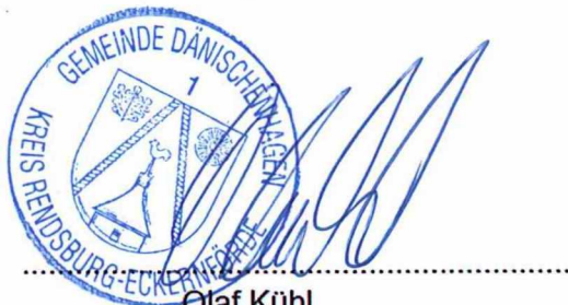
Olaf Kühl - Bürgermeister -