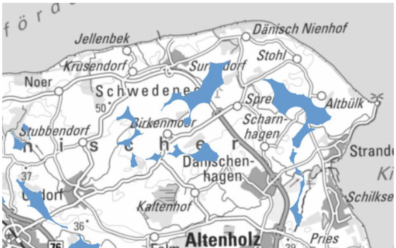
Abb.: Ausschnitt aus der Potentialflächenkarte (Potentialflächen: blaue Darstellung)

Im ersten Schritt führt die Anwendung der Kriterien zu Potentialflächen. Die Kriterien stellen Vorgaben dar, die nach dem Ausschlussprinzip funktionieren. Das bedeutet, dass alle Flächen ausgeschlossen werden, die von einer Windenergienutzung freigehalten werden sollen. Nach Anwendung aller Kriterien bleiben Flächen übrig. Wenn eine Fläche größer als 15 ha ist, wird sie als Potentialfläche ausgewiesen.