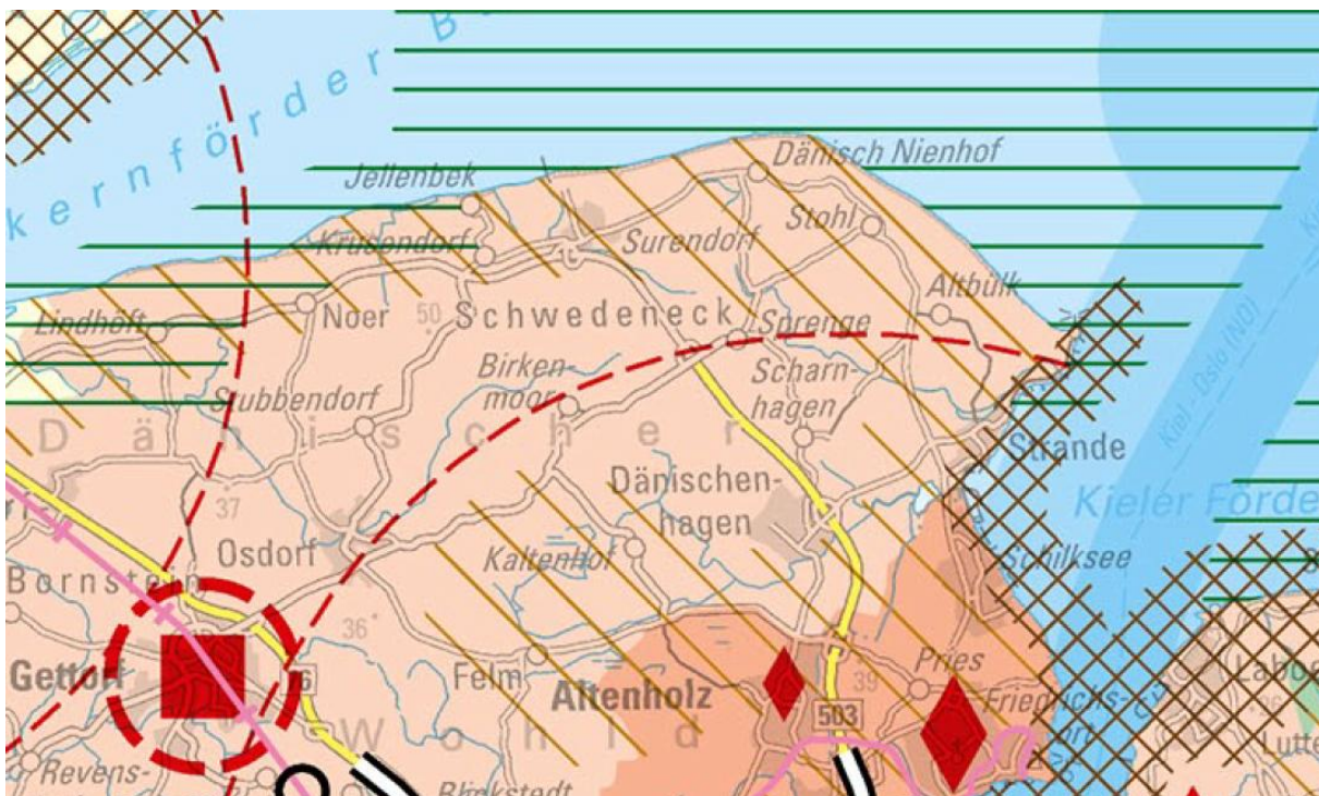
Abb.: Ausschnitt für die Gemeinde Schwedeneck aus dem Landesentwicklungsplan (2021)

Im Landesentwicklungsplan werden auch Aussagen zur Energiewende, zum Klimaschutz und zum Ausbau der erneuerbaren Energien getroffen. Danach soll bis 2045, d.h. in ca. 20 Jahren, der Ausstieg aus der Nutzung von fossilen Energieträgern vollzogen sein. Diese Zielsetzung erfordert einen massiven Ausbau der erneuerbaren Energien. Zu den erneuerbaren Energien zählen Wind, Solar, Biomasse, Wasserkraft und Geothermie. Planungen und Maßnahmen der Energiewende, insbesondere die Errichtung von Anlagen für die Erzeugung von erneuerbaren Energien, liegen im öffentlichen Interesse und sollen der Versorgungssicherheit dienen (vgl. LEP, Kap. 4.5 Energieversorgung, S. 225ff).