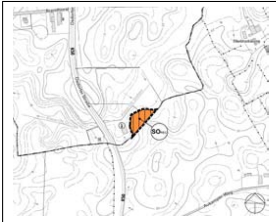
Abb. 02 11. Änderung F-Plan Osdorf

Die Darstellungen liegen dem erläuterten Planungskonzept und -zielen aus der nachfolgenden Planungsebene des vorhabenbezogenen Bebauungsplanes zugrunde.