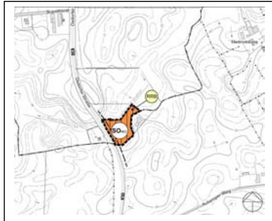
Abb. 03 3. Änderung F-Plan Noer