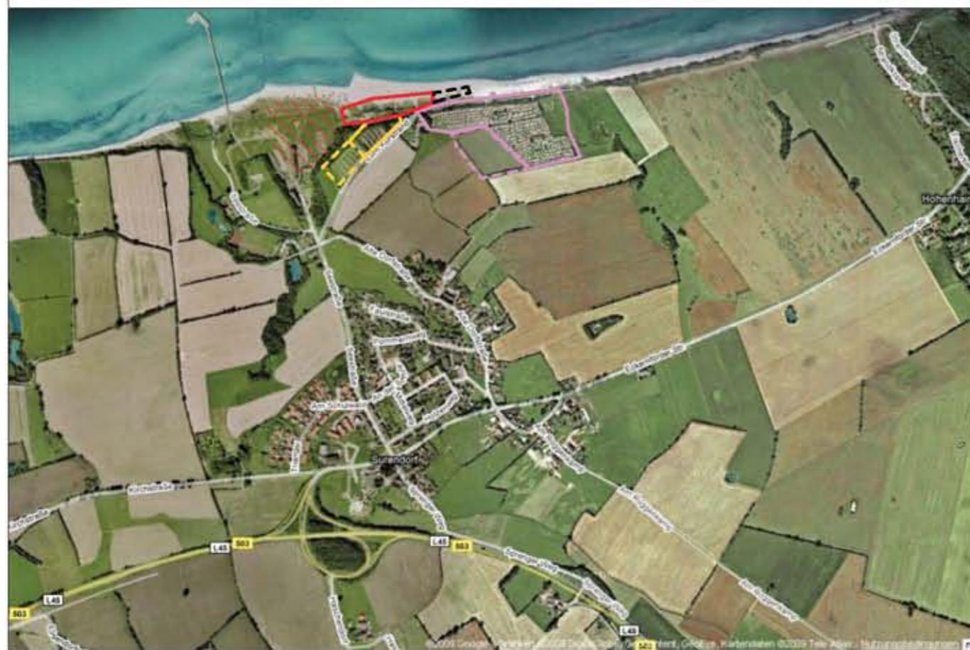
Anlage zur Begründung Übersichtsplan mit den weiteren Planungen bzw. Entwicklungsmöglichkeiten für touristische Nutzungen in der Gemeinde Schwedeneck.